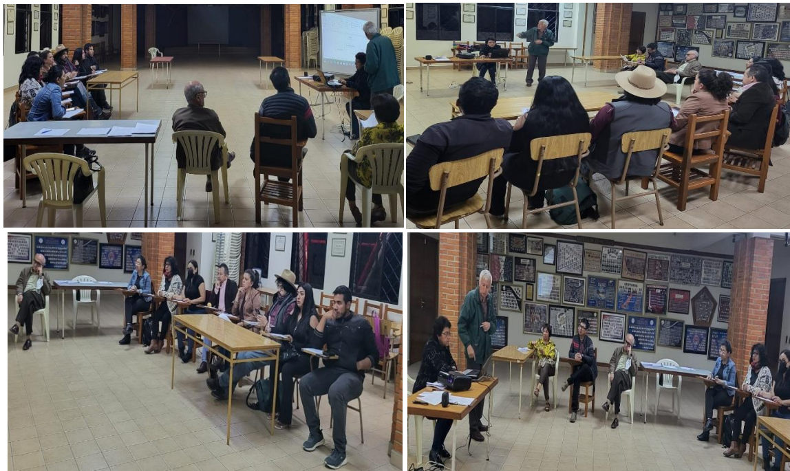
4to. Taller - Mesa de Incidencia Ciudadana Presentación y Debate